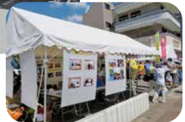
R4. 10. 8~9 尾張旭市民祭