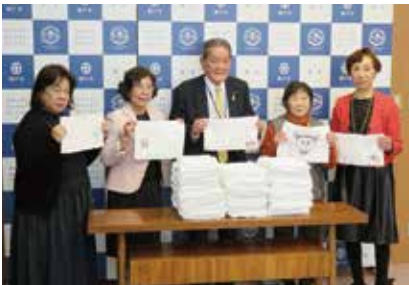
瀬戸市役所 福祉課 600枚寄贈