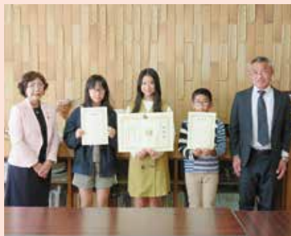
R4. 11. 25 三郷小学校