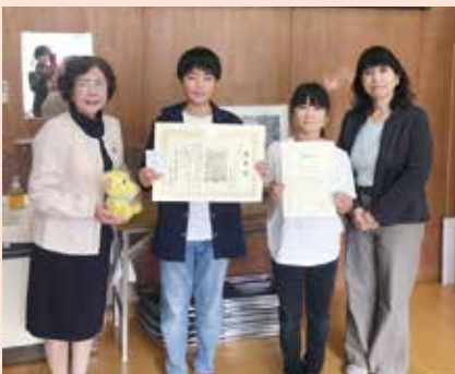
R4. 11. 24 本地原小学校