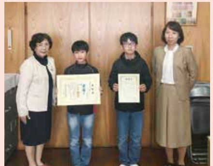
R4. 11. 24 旭丘小学校