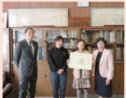
R4. 11. 25 水南小学校