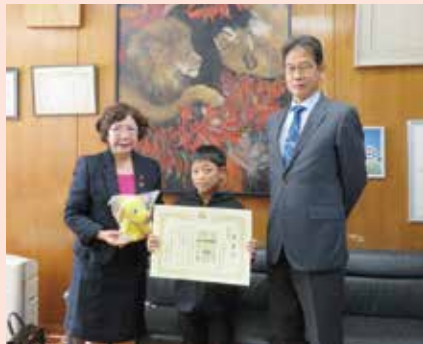
R4. 11. 16 白鳳小学校