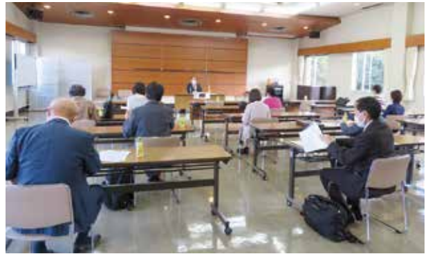
R4. 11. 8 決算期別説明会 瀬戸商工会議所 出席者12名