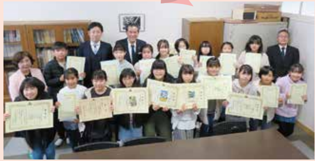
R4. 12. 6 長根小学校