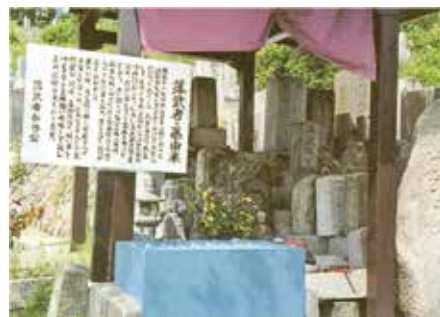
深川小学校跡地の裏にある墓地内の落武者のお墓。線香の煙りやお花がたえない。