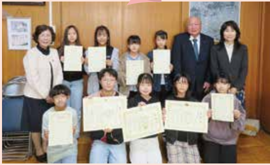
R4. 11. 28 瑞鳳小学校