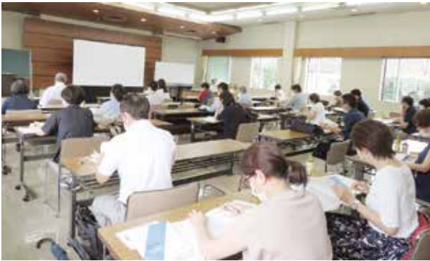
R4. 8. 17 決算期別説明会 瀬戸商工会議所 出席者24名