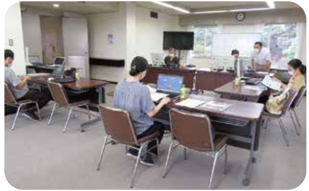
R4. 9. 1、9. 8 パソコン研修 瀬戸商工会議所 出席者各5名