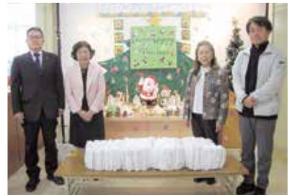
ノベルティ・こども創造館 200枚寄贈