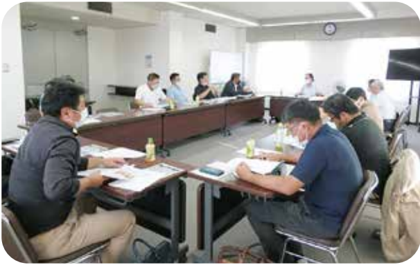
R4. 8. 2 広報委員会 瀬戸商工会議所 出席者11名