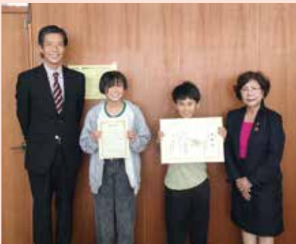
R4. 11. 15 東栄小学校