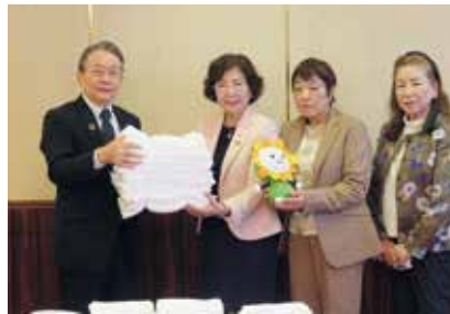
尾張旭市役所 福祉課 400枚寄贈